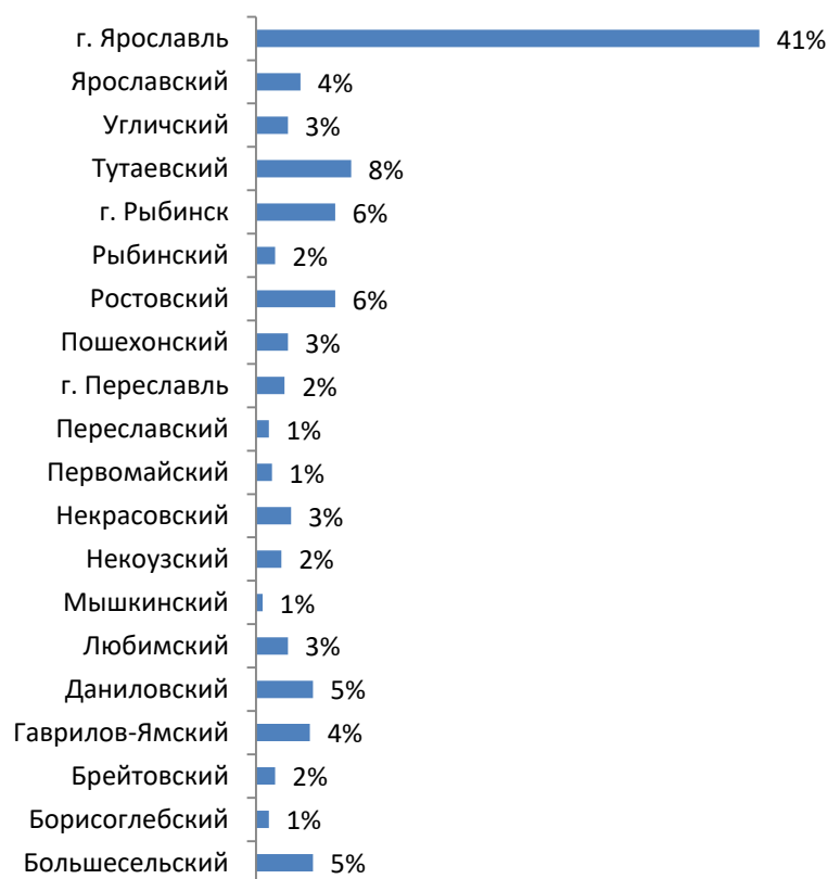
Диаграмма 2. Распределение участников образовательных мероприятий по муниципальным образованиям (доля в %):

Эта ситуация обусловлена естественными причинами, наличием в г. Ярославле большого числа учреждений культуры разного профиля, что формирует более широкую аудиторию потенциальных участников образовательных мероприятий.