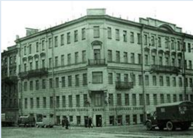
Зд. школы угол ул. Лермонтова и наб.р. Фонтанки. (с 1926 г.)

ДМШ им. Римского- Корсакова с сохранением отделения для взрослых