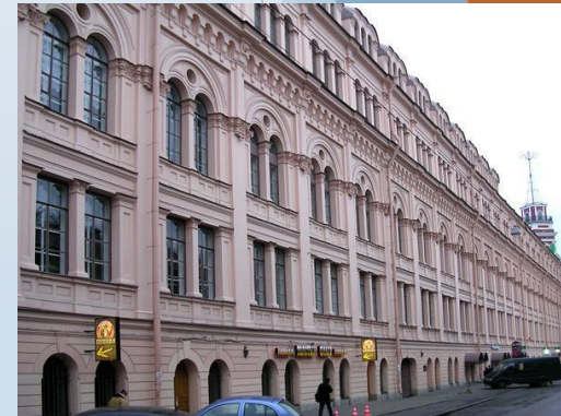
Современный вид. Ул. Думская. (с 1985 г.)